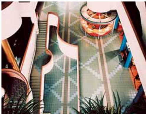
Фарфоровая неглазурированная плитка, укладываемая с помощью Kerabond T + Isolastic Общественное здание – Город Норс Йорк Онтарио (Канада)