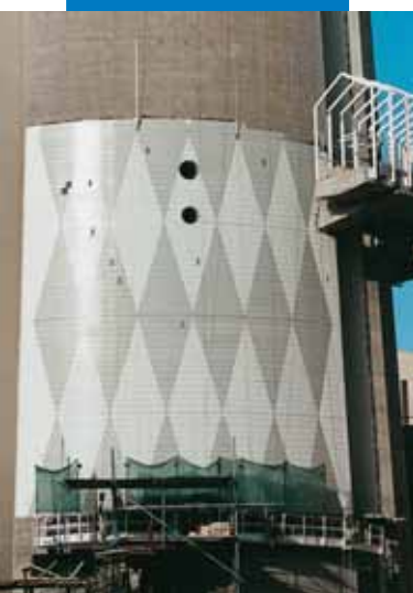
Пример укладки клинкера поверх бетона с помощью Kerabond T + Isolastic. Новая телекоммуникационная башня в Кувейт - сити (Кувейт)